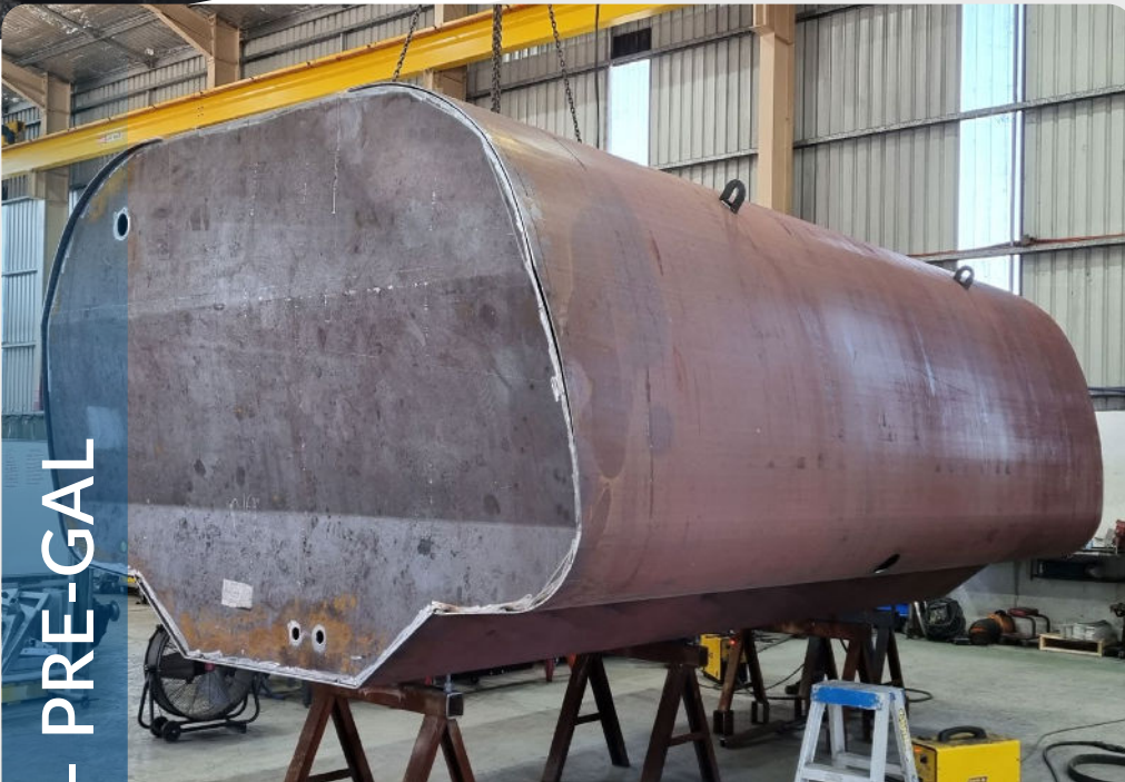
FABRICATED TANKS - PRE-GAL